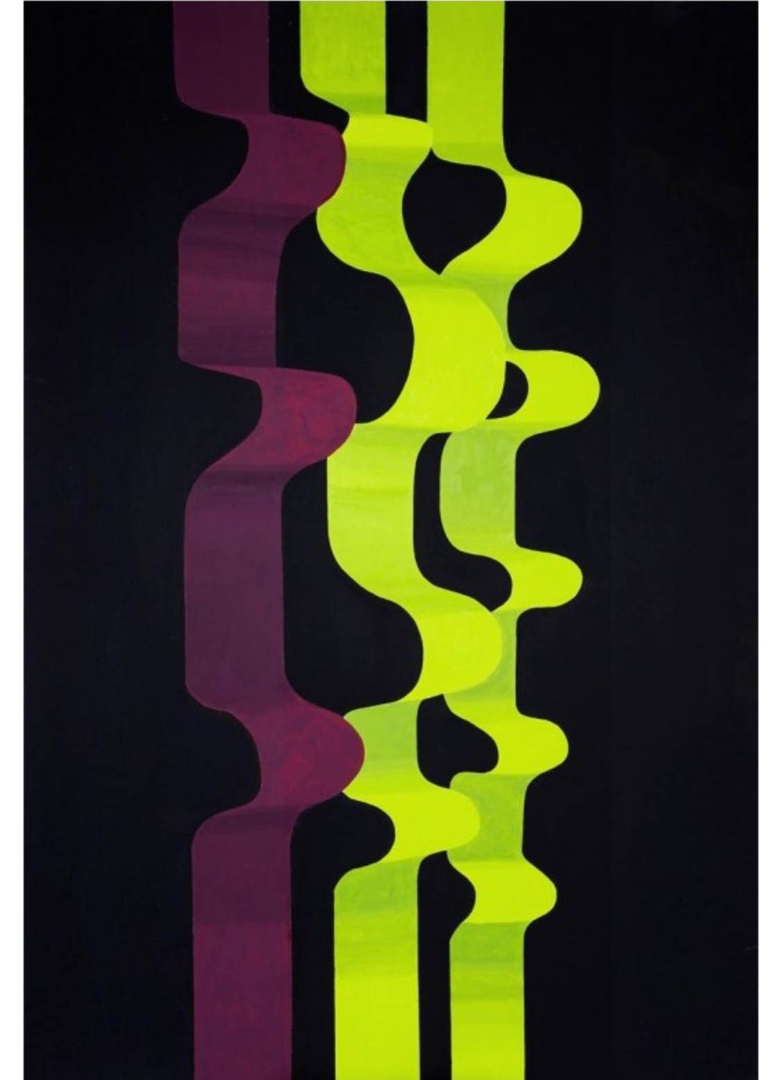
Janina Wierusz-Kowalska, „Banana ribbons”, 2012

Od 28 lutego w warszawskiej Galerii (-1) Polskiego Komitetu Olimpijskiego będzie można podziwiać prace malarki Janiny Wierusz-Kowalskiej. Kuratorem wystawy jest Kama Zboralska – dziennikarka i mecenas sztuki współczesnej.