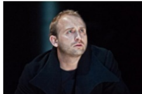
W poniedziałek ja, we wtorek ja...