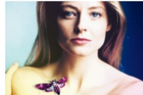
DLACZEGO NIE MOGĘ PRZESTĄĆ MILCZEĆ?