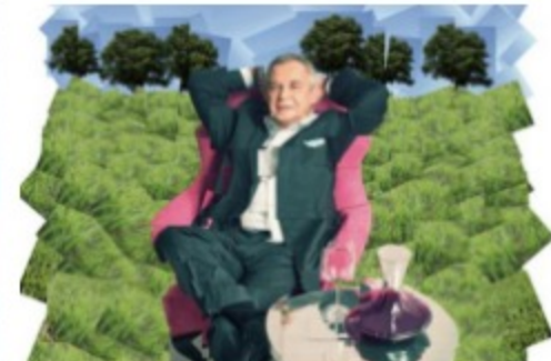
Najważniejsze jest najbliższe pięć minut