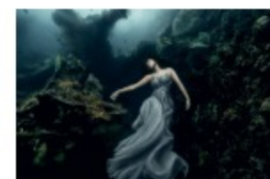
W służbie ziemi 2017-01-02 | art

Galeria (-1) Polskiego Komitetu Olimpijskiego, Warszawa, Wybrzeże Gdynskie 4