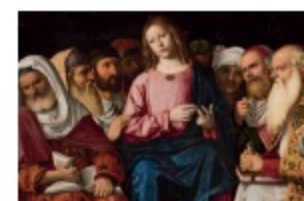
Perły sztuki dawnej 2016-12-19 | art